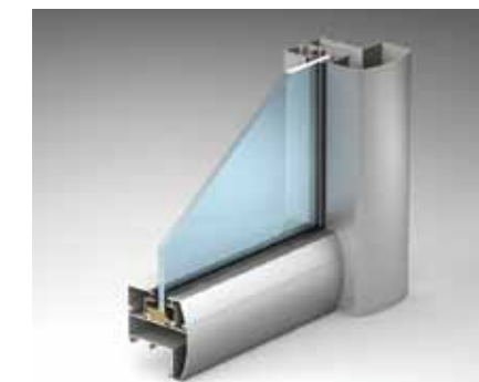
Сечение по ригелю (система ATVC65)