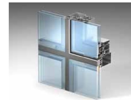
Структурное остекление ALTF50 SG

Специалисты компании ООО «Алютех Торговый дом» готовы предоставить более подробную информацию о всех новинках. Высокое качество продукции «АЛЮТЕХ», четкая политика ведения бизнеса компании открывают коммерческие перспективы для крупных корпоративных заказчиков и региональных дилеров.